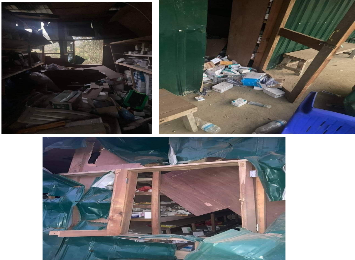
ပုံ (၄) - ဝိတိုရိယစခန်းအား လေကြောင်းဖြင့်တိုက်ခိုက်စဉ် ထိခိုက်သွားခဲ့သော ဆေးပစ္စည်းသိုလှောင်ရုံဟု ယူဆရသော ဓာတ်ပုံများ.

တိုက်ခိုက်မှုများကို မှတ်တမ်းတင်ခဲ့သည့် News Media အဖွဲ့များမှ တင်ထားခဲ့သော CNF ဌာနချုပ် တည်ရှိရာနေရာပြ ဓာတ်ပုံများထဲတွင် လမ်းမများအား ထိခိုက်မှုကို ပြသထားပြီး ကိုဩဒိနိတ် 23.069124, 93.346662 တွင်ဖြစ်သည်။ နောက်တစ်ပုံတွင် CDF အဆောက်အဦး တစ်ခုကိုပြသထားပြီး ကိုဩဒိနိတ် 23.069562, 93.347362 တွင် ဖြစ်သည်။