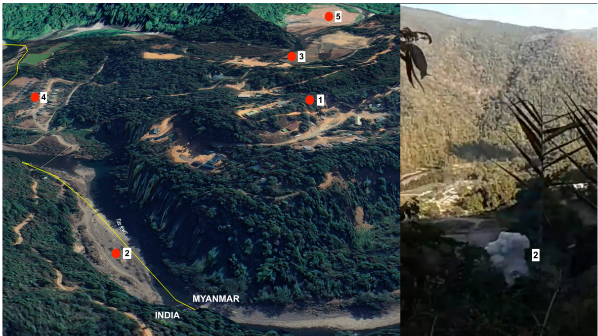
ပုံ (၉) - အဝါရောင်မျဉ်းမှာ နယ်စပ်ဒေသကို ပြသထားပြီး လေကြောင်းတိုက်ခိုက်မှုကြောင့် နယ်စပ်တွင် ကျရောက်ခဲ့သည့် ထိခိုက်မှုများ၏ တည်နေရာ ဖြစ်နိုင်ချေကို ပြသထားသည်။ ဗီဒီယိုထဲရှိ အချိန် ၁ မိနစ် ၄ စက္ကန့်ခန့်တွင် တွေ့မြင်နိုင်သော ထိခိုက်မှုတစ်ခုမှာ အန္တိယနယ်မြေအတွင်း ကျရောက်ခဲ့သည်ဟု ယူဆနိုင်သည်။