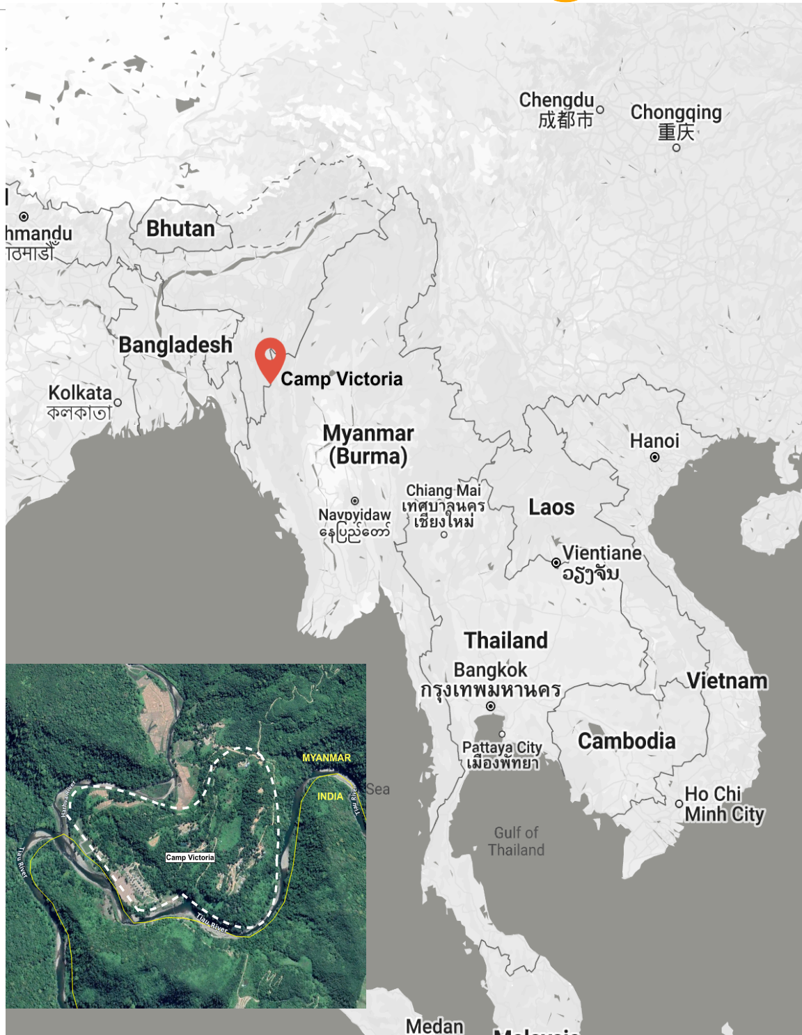
ပုံ (၁) - ဝိတိုရိယစခန်း တည်နေရာပြပုံ [23.069562, 93.347362].