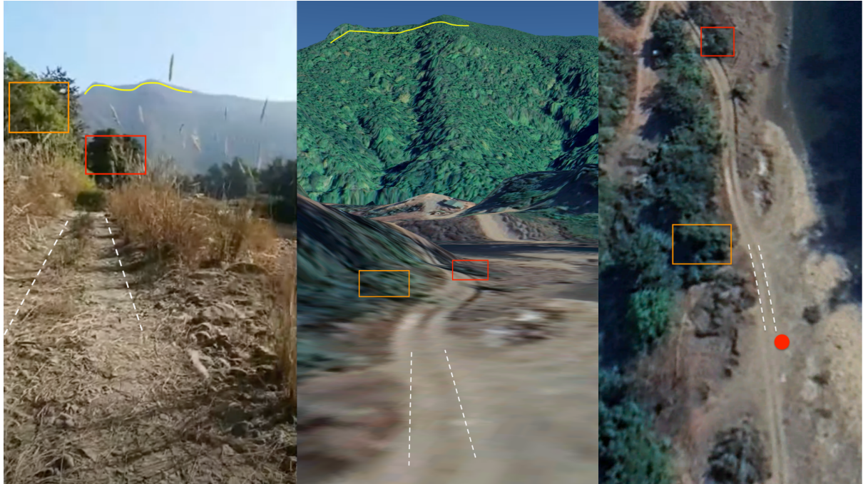
ပုံ (၈) - လေကြောင်းတိုက်ခိုက်မှုအား အန္တိယနိုင်ငံပိုင်နက်အတွင်းရှိလူများ ကြည့်နေကြောင်းပြပုံ၊ ကိုဩဒိနိတ် 23.068715, 93.341690။ ဗီဒီယိုထဲတွင် အန္တိယနိုင်ငံနယ်နိမိတ်ထဲသို့ ကျရောက်ခဲ့သော 'မြန်မာ့ဗုံး' အဖြစ် ဖော်ပြထားသည်။.