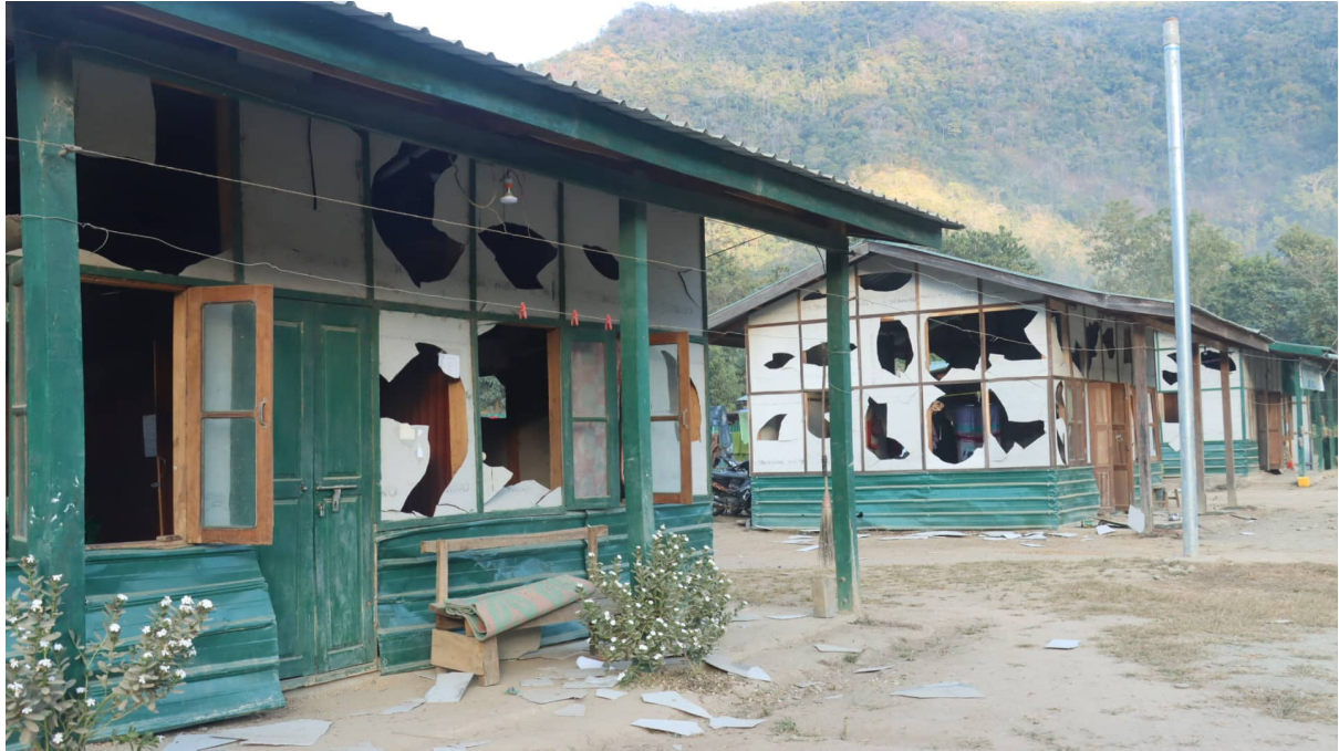
ပုံ (၆) - ပျက်စီးမှုများကို ထင်ရှားစွာတွေ့မြင်နိုင်သော အဆောက်အဦးများပြ မြေပုံ၊ ကိုညွှန်နိတ် 23.069562, 93.347362 ဝန်းကျင်.