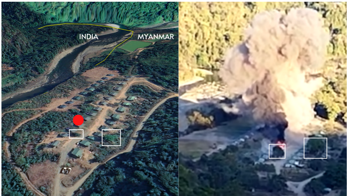
ပုံ (၇) - ၂၀၂၃ ခုနှစ်၊ ဇန်နဝါရီလ ၁၁ ရက်တွင် ပို့စ်တင်သူမှ စွပ်စွဲထားသော (ဖြစ်နိုင်ချေလည်းရှိသော) ဝိတိုရိယစခန်းအား လေကြောင်းဖြင့် တိုက်ခိုက်ခဲ့ကြောင်းပြပုံ။ ဤပုံရိပ်ကို Myanmar Witness မှ ကိုညွှန်နိတ် 23.069747, 93.346014 ဝန်းကျင်တွင် ဖြစ်ပွားခဲ့ကြောင်း ခြေရာခံခဲ့သည်.