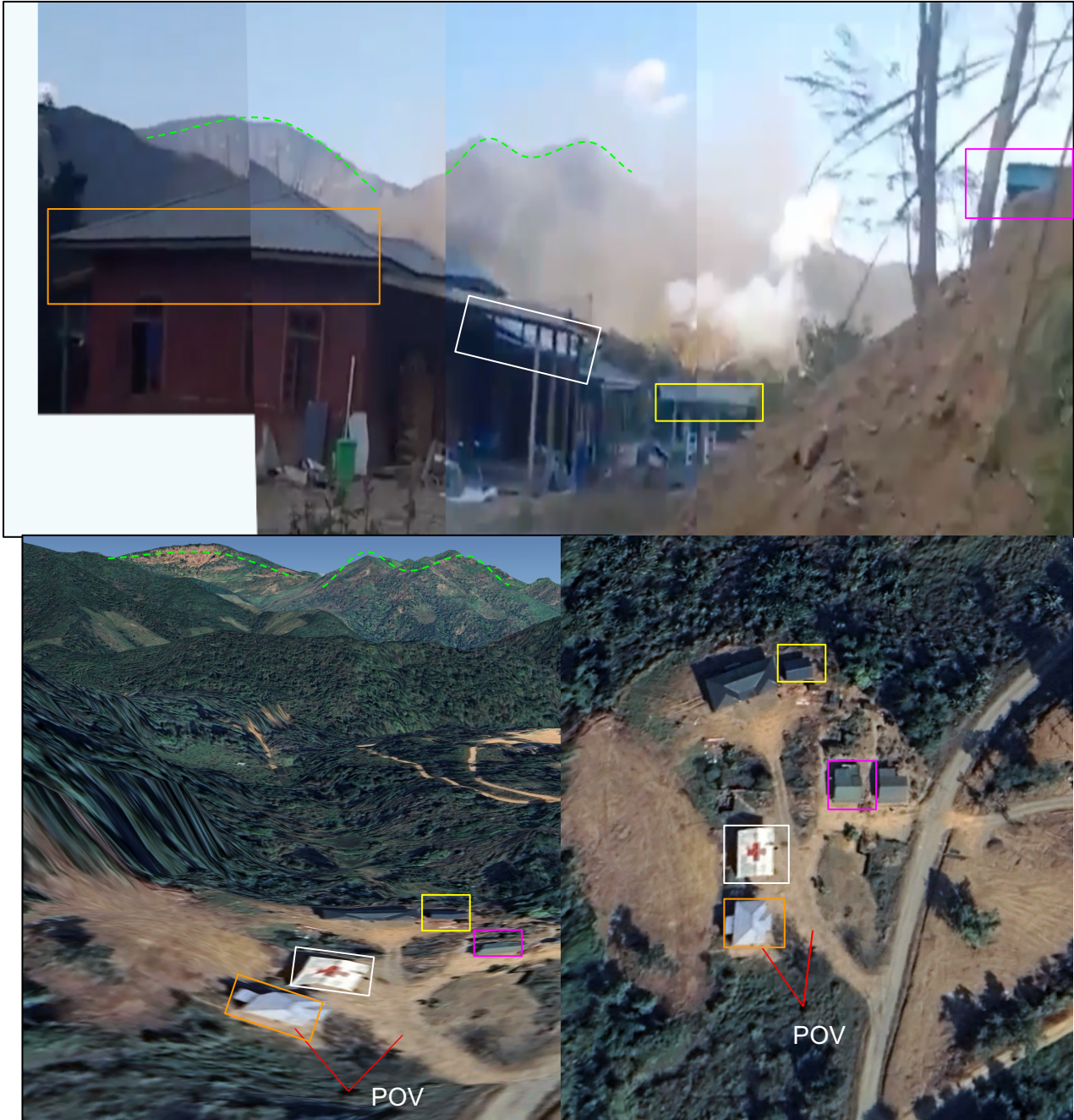
ပုံ (၃) - ဝိတိုရိယစခန်းအတွင်းတွင် ရိုက်ကူးထားပြီး လေကြောင်းတိုက်ခိုက်မှု၏ တည်နေရာပြပုံ [23.060792, 93.346693]

ပါရှိသော 'ကြက်ခြေနီ' တံဆိပ် ဖြစ်ပြီး ဤတံဆိပ်မှာ ပဋိပက္ခဖြစ်စဉ်များတွင် ပစ်မှတ်မထားသင့်ဘဲ အကာအကွယ်ပေးသင့်သော နေရာဖြစ်ကြောင်း နိုင်ငံတကာမှ သတ်မှတ်ထားသော တံဆိပ်ဖြစ်သည်။