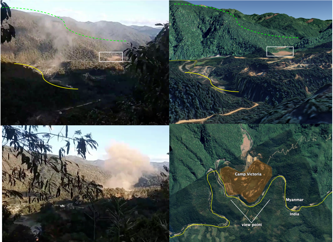
ပုံ (၂) - မီးခိုးငွေ့များအပြီးတွင် တွေ့ရသော အခြေအနေကို ပြသထားသော တည်နေရာပြပုံ [23.068271, 93.340013].

Myanmar Witness အနေဖြင့် တိုက်ခိုက်ခံခဲ့ရသည့် ဧရိယာတည်နေရာများကို ရှာဖွေနိုင်ရန် ဝိတိုရိယစခန်း အနီးအနားတွင် ရိုက်ကူးထားသော ပုံရိပ်များကို ဂြိုဟ်တုဓာတ်ပုံဖြင့် တိုက်ဆိုင်စစ်ဆေးခဲ့သည်။ ရိုက်ကူးမှု တစ်ခုထဲတွင် (ထို ရိုက်ကူးမှုကို တင်ဆက်ခဲ့သူ၏ လုံခြုံရေးကို ကာကွယ်နိုင်ရန်အတွက် ဤတွင် မဖော်ပြထားပါ) ဝိတိုရိယစခန်းနှင့် ပတ်ဝန်းကျင် မြင်ကွင်းကျယ်အားတွေ့မြင်နိုင်ပြီး လေကြောင်းတိုက်ခိုက် မှုပုံစံကို လေ့လာကြည့်ရှုရာတွင် အထောက်အကူပြုထားကြောင်း တွေ့ရှိခဲ့ရသည် (ပုံ - ၃)။