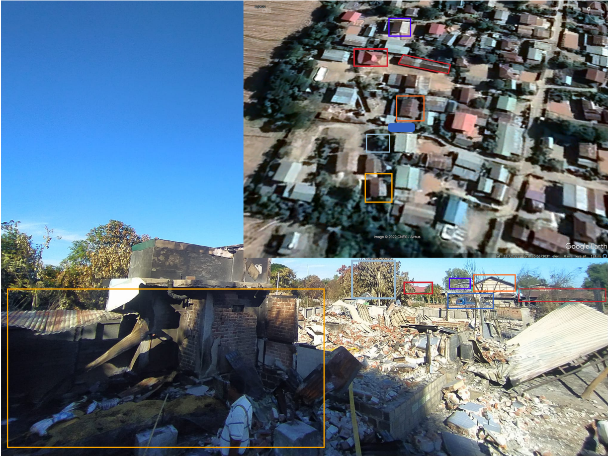
ပုံ ၉- ပေါင်းလုံကုန်းကျေးရွာတွင် မီးလောင်မှုကြောင့် ပျက်စီးသွားသော စပါးရုံဒေါင်၏ တည်နေရာအတည်ပြုစစ်ဆေးချက်။ [22.722084, 95.567265]