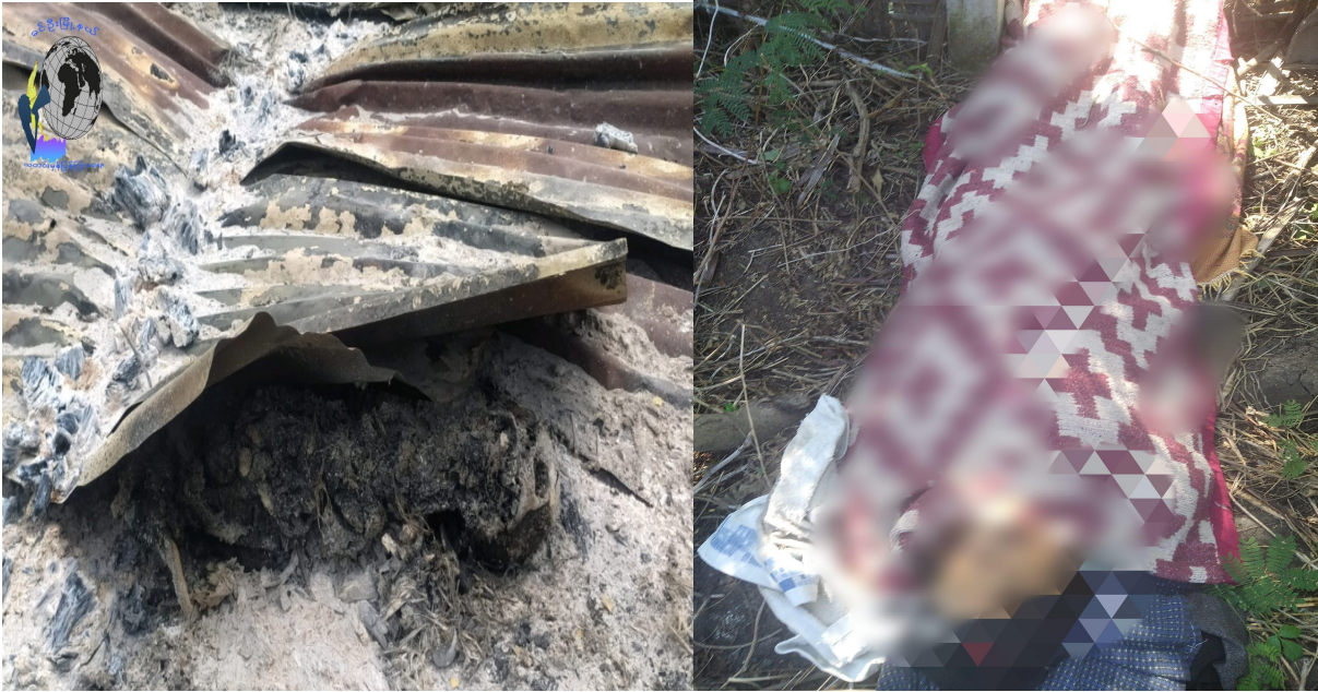
ပုံ ၇ - မီးရှို့ခံရသူ၏ရုပ်ကြွင်းတခုနှင့် အခြား အမည်မသိရုပ်အလောင်း

ပေါင်းလွဲကုန်း ကျေးရွာ စစ်ဆင်ရေးအတွင်း SAC တပ်ဖွဲ့ဝင်များသည် ဒေသခံအရပ်သားနှစ်ဦး အား သတ်ဖြတ်ခဲ့ကြောင်း သိရသည် (ပုံ၇)။ အဆိုပါ အရပ်သားနှစ်ဦးမှာ ၎င်း၏နေအိမ်တွင် အရှင်လတ်လတ် မီးရှို့သတ်ဖြတ်ခံခဲ့ရသည့် အသက် ၈၀ ဝန်းကျင်ခန့်ရှိ သက်ကြီးရွယ်အို အမျိုးသမီးတစ်ဦးနှင့် လက်နက်ကြီးထိမှန်ကာ သေဆုံးခဲ့ရသည့် အသက် ၅၃ နှစ်အရွယ် အမျိုးသားတစ်ဦးတို့ဖြစ်ကြောင်း သိရသည်။ ကျန်ရွာသားများသည် အနီးနားကျေးရွာများရှိ ပြည်တွင်းရွှေ့ပြောင်းဒုက္ခသည်စခန်းများသို့ ထွက်ပြေးတိမ်းရှောင်ကြပြီး ၎င်းတို့၏ ပိုင်ဆိုင်မှုများနှင့် ပစ္စည်းများကို SAC တပ်ဖွဲ့ဝင်များက ဖျက်ဆီးခြင်း သို့မဟုတ် သိမ်းယူခြင်း ခံခဲ့ရသည်။