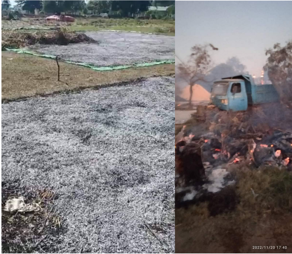
ပုံ ၈ - (ဘယ်မှ ညာ) (က) စပါးပုံ တစ်စိတ်တစ်ပိုင်း မီးလောင်ပျက်စီးပုံ။ (ခ) ဖြစ်နိုင်ခြေရှိသောစပါးရိတ်သိမ်းစက်ပျက်စီးခြင်း။ (ဂ) ဗီဒီယိုမှတ်တမ်းအဆုံးတွင်တွေ့ရသော မီးလောင်ထားသည့်စပါးပုံ (ဃ) နမ်းသို့လောင်ရုံ ၏အကြွင်းအကျန်ဖြစ်နိုင်ချေရှိသော မီးလောင်ရာနေရာ (သတင်းအရင်းအမြစ်အား ကိုယ်ရေးကိုယ်တာ အကြောင်းပြချက်များကြောင့် ပြန်လည်ပြင်ဆင်ထားသည်) (င) အပြာရောင် ထရပ်ကားနောက်တွင် မီးလောင်မှုအကြွင်းအကျန်များကြားမှ ဖြစ်နိုင်ချေရှိသောစပါးပုံ။