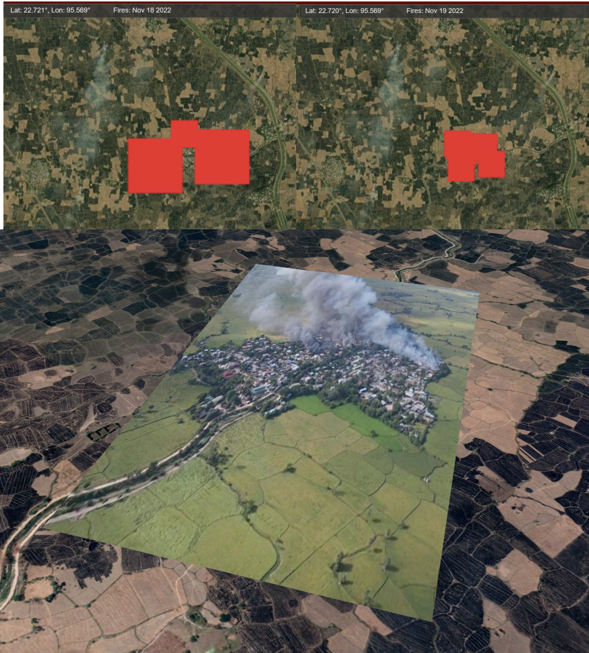
ပုံ ၂- (အပေါ်ပုံ) ၂၀၂၂ ခုနှစ် နိုဝင်ဘာလ ၁၈ ရက်နှင့် ၁၉ ရက်တို့တွင် ပေါင်းလုံကုန်းကျေးရွာရှိ အပူရှိန်ကွဲထွားများ။ (အောက်ပုံ) အဆိုပါကျေးရွာ မီးလောင်နေသည့် ရုပ်သံမှတ်တမ်း။ [22.71946907, 95.56994629]