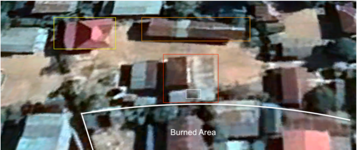
ပုံ ၅- မီဒီယိုတွင် ပြသထားသည့် ပျက်စီးဆုံးရှုံးမှုများ၏ တည်နေရာအတည်ပြုချက် (ကိုးကားနိုင်ရန်အတွက် ပုံ အငြိမ် နှင့်တကွ ပြသထားသည်)။ [22.722084, 95.567714]