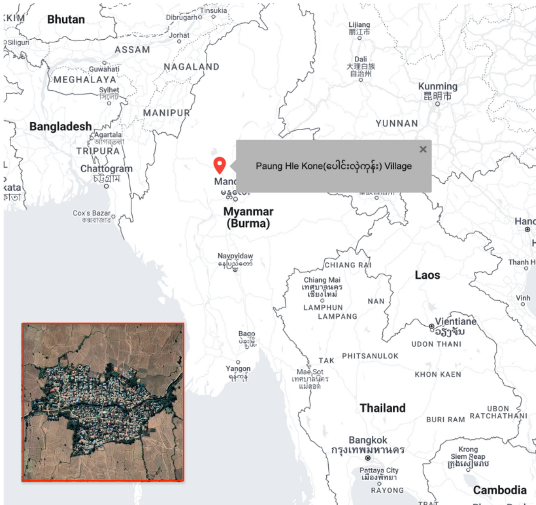
ပုံ ၆ - စစ်ကိုင်းတိုင်းဒေသကြီး၊ ခင်ဦးမြို့နယ်၊ ပေါင်းလုံကုန်းကျေးရွာ၏ မြေပုံ။ [22.720647, 95.569427]