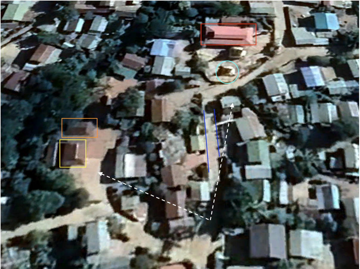
ပုံ ၄ - UGC တွင်ပြသထားသော ပျက်စီးဆုံးရှုံးမှုများ၏ တည်နေရာအတည်ပြုချက် (သတင်းအရင်းအမြစ်အား ကိုယ်ရေးကိုယ်တာ အကြောင်းပြချက်များကြောင့် ပြန်လည်ပြင်ဆင်ထားသည်) [22.720263, 95.567659]