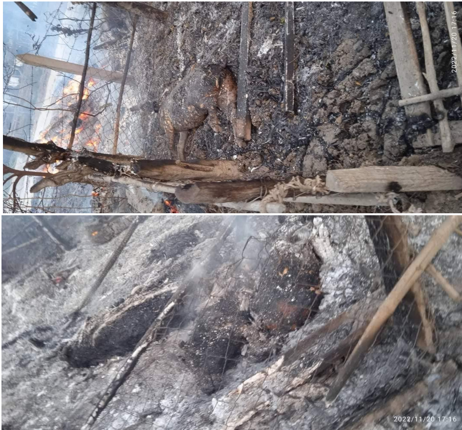
ပုံ ၁၀- (အပေါ်ပုံ) မွေးမြူရေးတိရစ္ဆာန်များ၏ မီးရှို့ခံရမှုအကြောင်းအကျဉ်းများ။ (အောက်ပုံ) ဖြစ်နိုင်ဖွယ်ရှိသောလယ်တောတိရစ္ဆာန်များ၏ မီးရှို့ခံရမှုအကြောင်းအကျဉ်းများ။